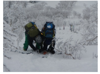
合わないためバンドで補強