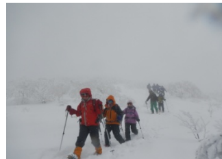
ホワイトアウトの下山